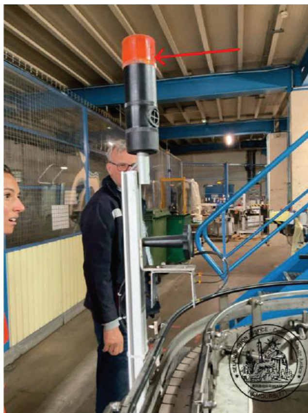
Signal lumineux avertissant l'employé du passage de 67 bouteilles de lessive (03/09/2025 09:33:40)

Je constate que les tickets sont correctement répartis lors du lancement de la production et me retire du site de production à 09h47.