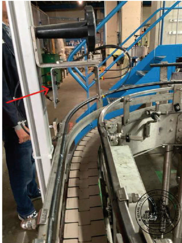
Système de détection et de comptage des bouteilles (03/09/2025 09:33:43)